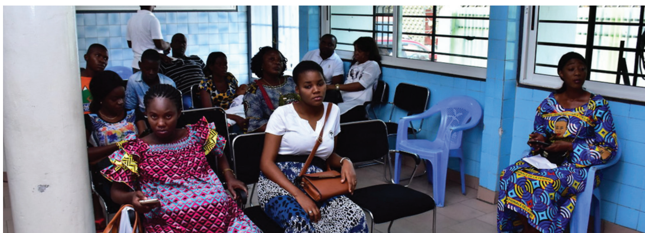
Un centre de dépistage des cancers du sein et du col de l'utérus à Kinshasa