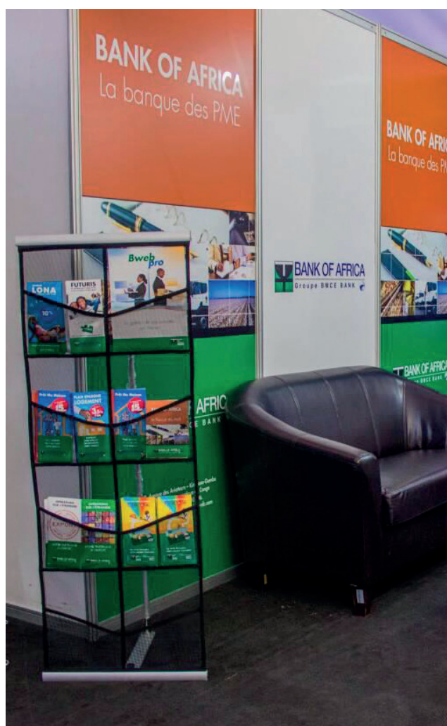
Stand BOA à la Semaine Française de Kinshasa