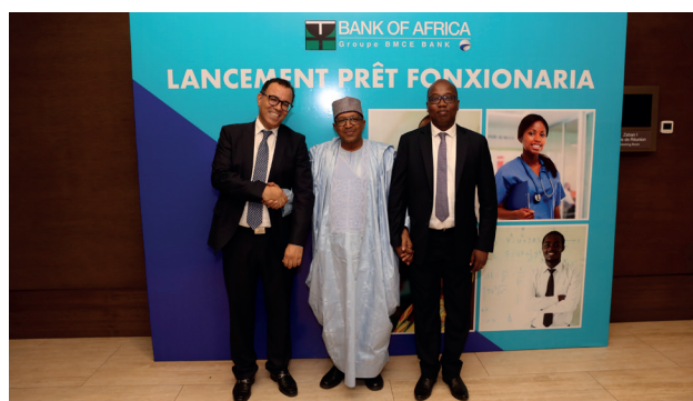
Cérémonie de lancement du Prêt Fonxionaria