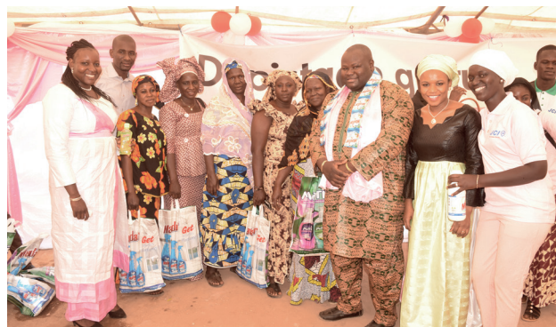
Opération de dépistage des cancers du sein et du col de l'utérus