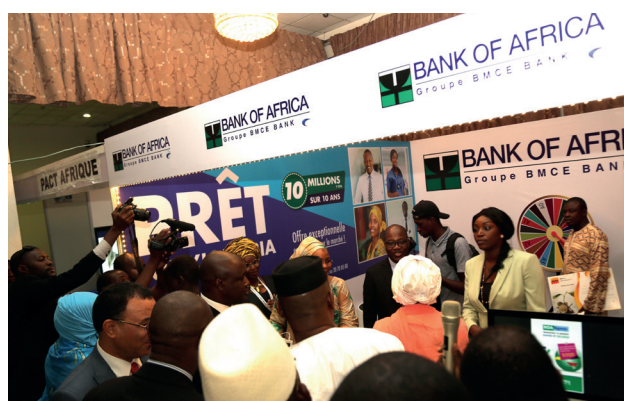
Salon des banques et établissements financiers