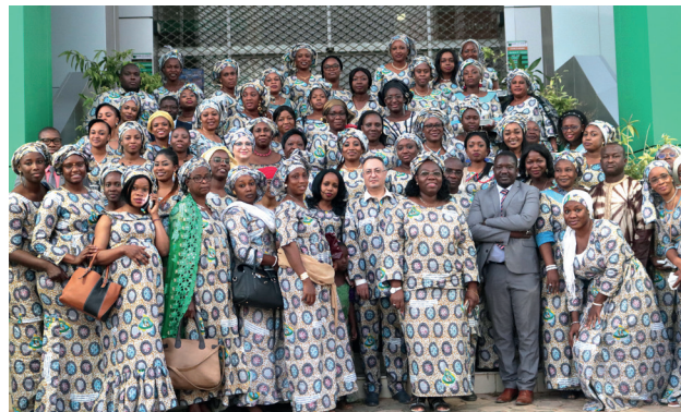
Fête du 8 mars avec les femmes de la Banque