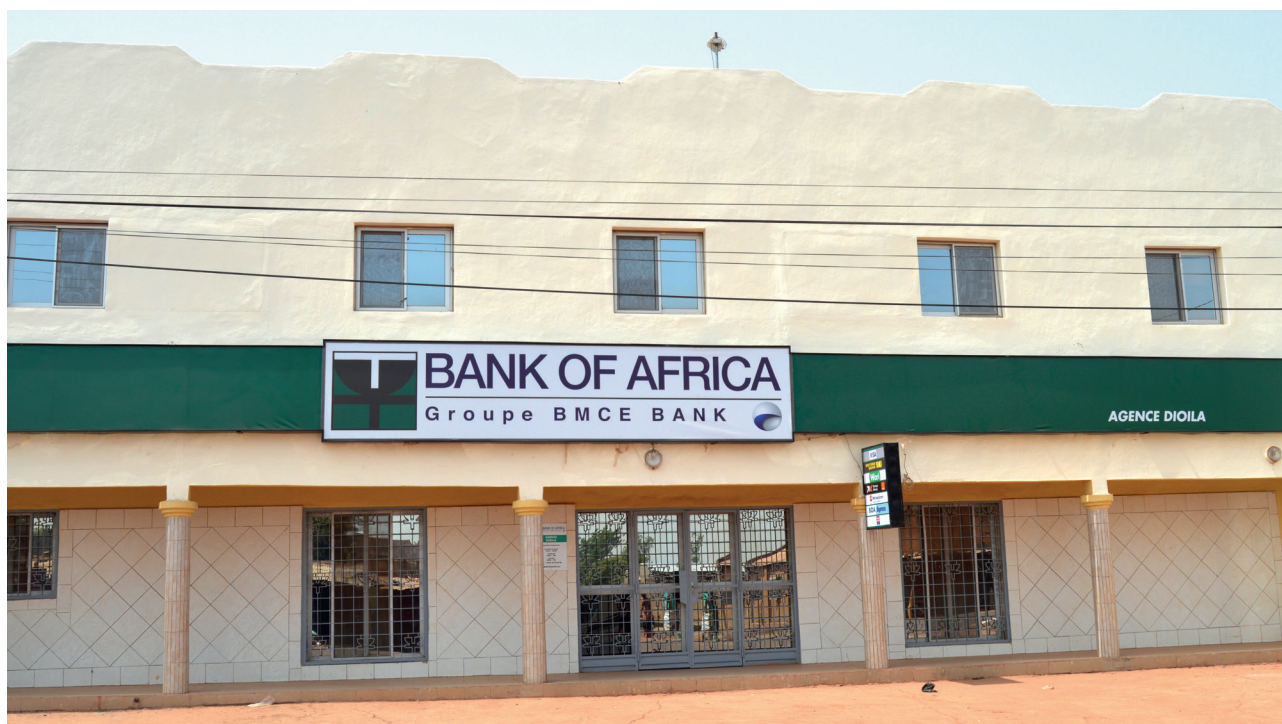
Nouvelle agence de Dioila